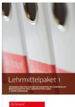
Lehrmittelpaket 1 (EBA)

Auf „ LEHRMITTELPAKET “ klicken und passendes Lehrmittelpaket suchen.